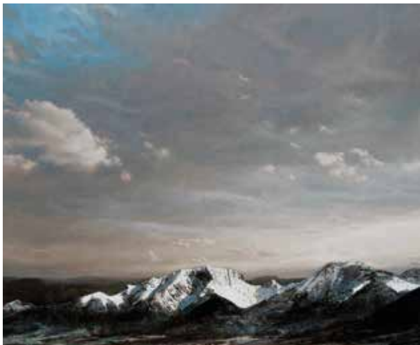
Grenoble · 2016 · Acryl auf Holz, 64 x 76 cm

Ministerium für Bildung, Wissenschaft, Jugend und Kultur, Mainz; Graphische Sammlungen der Bauten des Bundes in Berlin; Graphische Sammlung Veste Coburg; Stadt Tauberbischofsheim; Purdue Permanent Collection, West Lafayette, Indiana, USA; Museum Wilhelm Morgner, Soest