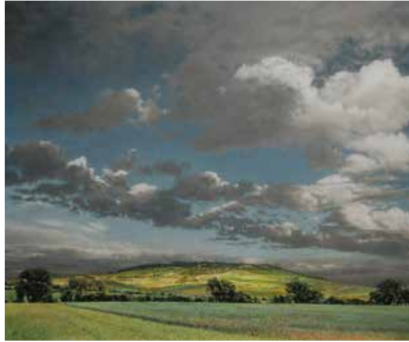
Wißberg von Westen · 2017 · Acryl auf Holz, 64 x 76 cm