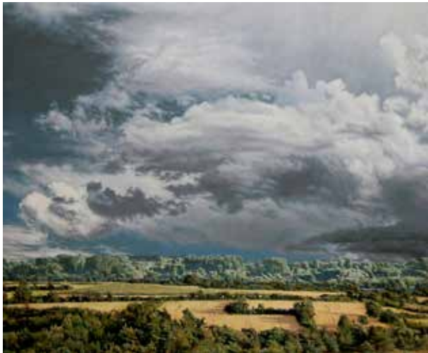
Rheinauen · 2016 · Acryl auf Holz, 64 x 76 cm