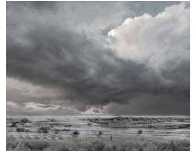
Sky-Scape 10 · 2013 · Acryl auf Leinwand, 105 x 125 cm