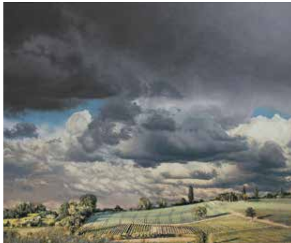
Blick vom Wißberg · 2016 · Acryl auf Holz, 64 x 76 cm