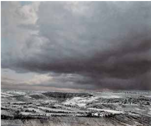
Wißberg im Schnee · 2017 · Acryl auf Holz, 64 x 76 cm