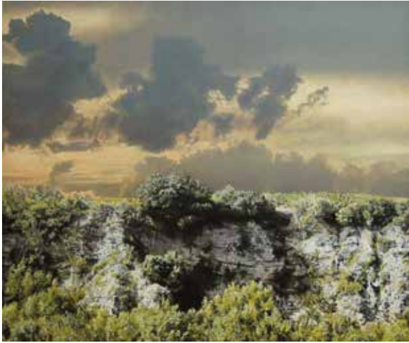
Schlucht des Lagamas · 2014 · Acryl auf Holz, 64 x 76 cm

Der weite Blick in die Landschaft schafft durch ihre Transparenz ein Gefühl von Größe und Erhabenheit. Die Gliederung der Landschaft, bedingt durch Wein- und Olivenanbau, schafft in der Ferne jene engmaschige durchdringende Feldstruktur, die die Ästhetik der Bilder prägt. Farben variieren durch unterschiedliche Vegetationen, Brachland und offene Flächen. Das Licht des Südens differenziert hier immer wieder aufs Neue.